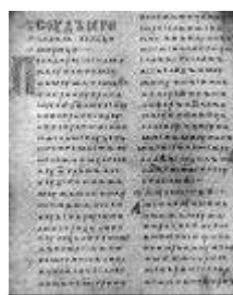
Двинская уставная грамота

Лихоимец – жадный вымогатель, взяточник».