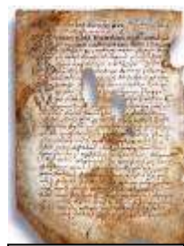
Псковская судная грамота

Двинская уставная грамота 1397 года. Мздоимство упоминается в русских летописях XIV века, например в Двинской уставной грамоте 1397 года в статье 6: «А самосуда четыре рубли, а самосуд то: кто изыснав татя с поличным, да отпустит, а себе посул возьмет, а наместники доведаются по заповеди, ино то самосуд, а опричь того самосуда нет». Там же, в статье 8: «...а черес поруку не ковати, а посула в железех не просити; а что в железех посул, то не в посул».